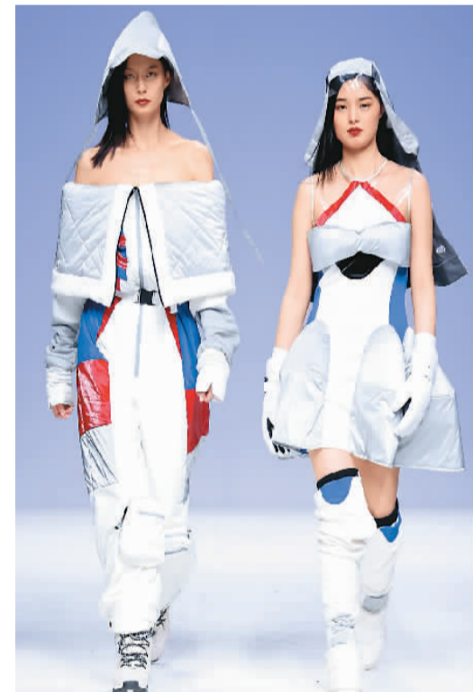
5月15日,在2021中国国际大学生时装周首场时装周“中国美术学院设计艺术学院2021届服装艺术设计专业生作品发布会”上,模特在展示作品。