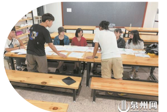
學員們討論作品理念

泉州網9月1日訊（記者王宇靜 文/圖）近日，2021泉州海峽兩岸大學生設計工作坊頒獎儀式舉行。11個企業專場，27所設計高校的23名導師與214名學員參與，共催生289件智慧作品，最後共評出金銀銅獎111件，其中金獎11件，銀獎33件，銅獎67件。