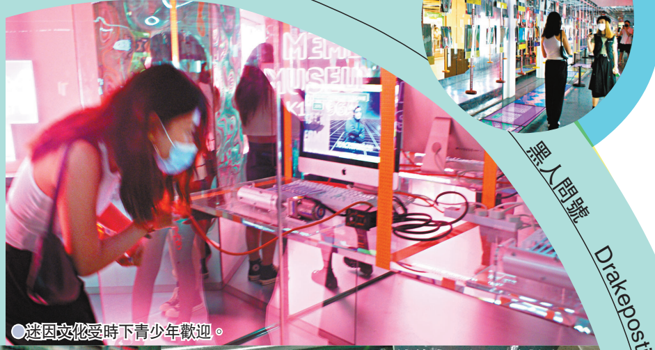
●迷因文化受時下青少年歡迎。