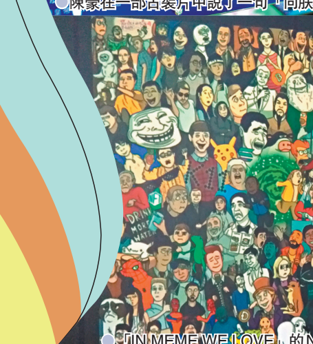
●「IN MEME WE LOVE」的NFT作品。