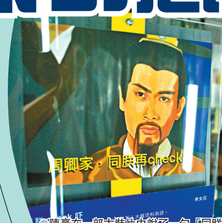
●陳豪在一部古裝片中說了一句「同朕check吓」也十分經典。