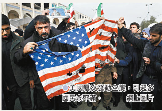
美國屢次發動空襲，引起多國民眾不滿。

此外，伊拉克曾遭受國際制裁多年，加上美軍入侵後戰火頻仍，完全扼殺伊拉克的發展空間，當地年輕人也錯失與世界交流的機會。若非美國的所作所為，伊拉克的政治、經濟及社會或有更好的前景。 ●綜合報導