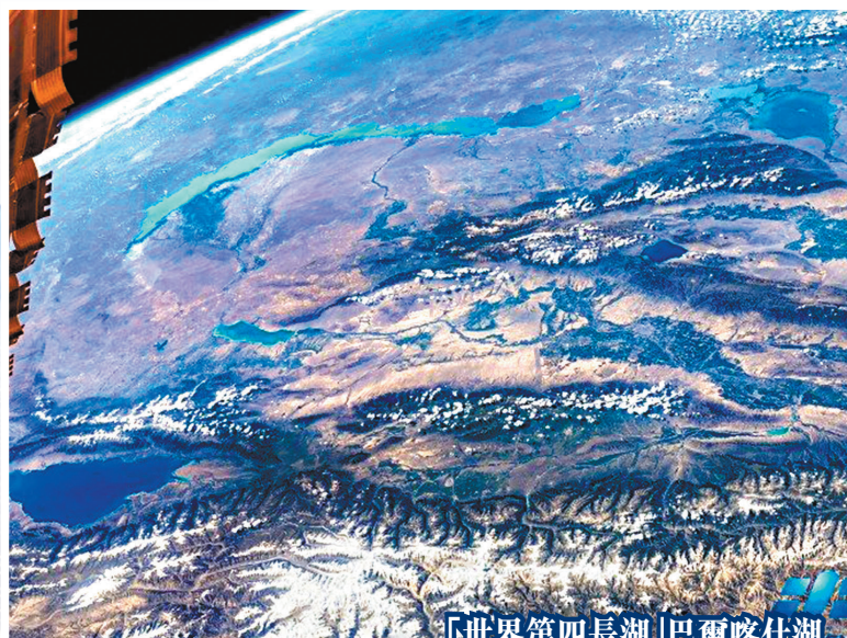
「世界第四長湖」巴爾喀什湖

中國載人航天工程辦公室官方發布神舟十二號航天員第二批在軌拍攝的高清圖片。恬靜的湖泊如大地明鏡，高原戈壁上綠洲點點如星辰，這個繞着太陽默默自轉的地球上，每一寸山河都孕育了生命的浪漫，其中的兩幅作品，讓我們看到了中國新疆地區寧靜祥和的美麗景色。