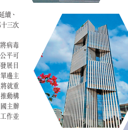
▲2021中國服貿會首鋼展區，來自印度的商家為顧客介紹本國商品。 ▲總部位於上海的金磚國家新開發銀行。