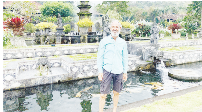
艾马尔先生在水上皇宫内