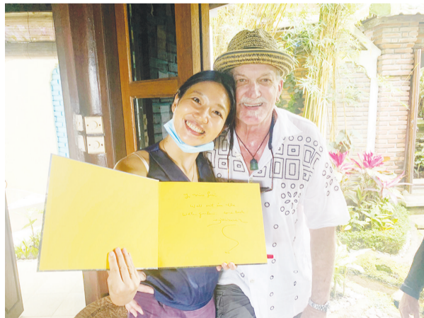
迈克先生赠予作者《Tirta Gangga》一书并亲笔签名