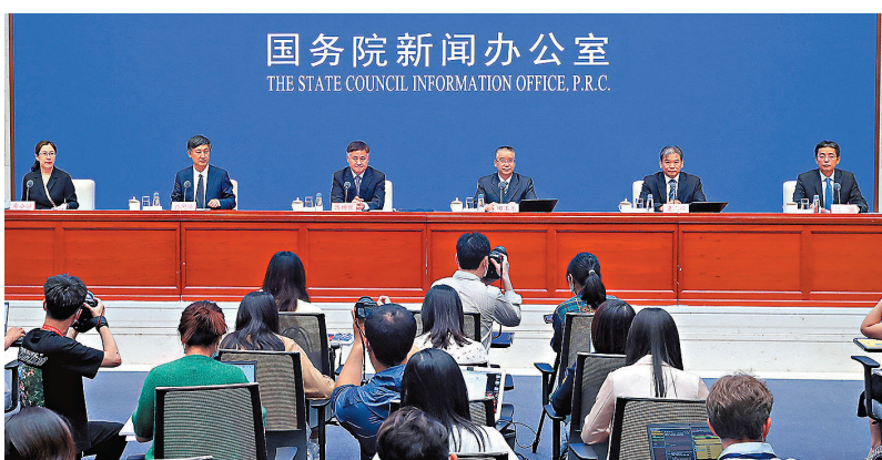
● 國新辦舉行政策例行吹風會，中國人民銀行副行長、國家外匯管理局局長潘功勝，工業和信息化部黨組成員、總工程師、新聞發言人田玉龍，工業和信息化部中小企業局局長梁志峰，人民銀行貨幣政策司司長孫國峰，人民銀行金融市場司司長鄒淵等出席。

中信證券分析，當前移動互聯網紅利逐漸消退的背景下，新的內容和消費場景革命，有望開啟新的紅利期，元宇宙被認為是下一代互聯網交互形式的革命。據公開報道，內地規模最大的VR獨角獸Pico發布稱已被字節跳動收購。傳聞收購對價達90億元。沉寂數年的VR因為搭上元宇宙概念，突然成為科技圈最火賽道之一。除字節跳動、騰訊、Facebook等巨頭也在積極布局元宇宙相關領域。