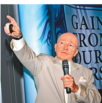
● 麥樸思明言，不知道索羅斯對中國悲觀的看法依據何在。 資料圖片