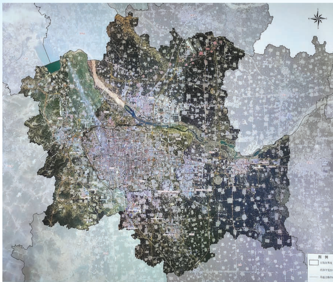
在本屆數博會上展出的，由超圖集團攝於2021年5月，6月份製作完成的「石家莊市「1+4」組團圖」。基於「一張圖」實現環境空間信息資源整合、環境信息共享、數據價值提升和環境業務協同。

石家莊常山北明科技股份有限公司重磅發布了數項重大智慧城市創新應用的新實踐，包括基於證照鏈的「一碼通城」、打通多業務場景的「一碼通城」、為河北省數字經濟賦能的常山雲數據中心，以及一系列具有創新