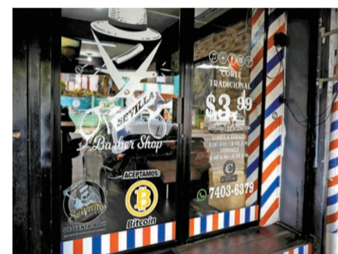
薩爾瓦多當地的店舖外貼上了支持比特幣支付的圖標。

受上述消息影響，昨晚美股盤前比特幣礦業漲5.56%。此前，比特幣價格一度逼近53000美元。截至昨夜10時30分，比特幣價報50219.32美元。