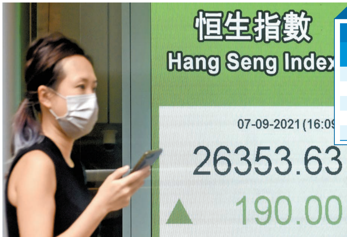
「前海方案」公布後，深圳概念股炒上，連帶港股連升第二日，收報26353.63點，升190點。

【香港商報訊】記者邱媛媛報導：中共中央、國務院周一(6日)發布《全面深化前海深港現代服務業合作區改革開放方案》(簡稱「前海方案」)，包括將前海合作區總面積擴大逾7倍至120平方公里，深圳相關概念股昨日造好，集體向上。