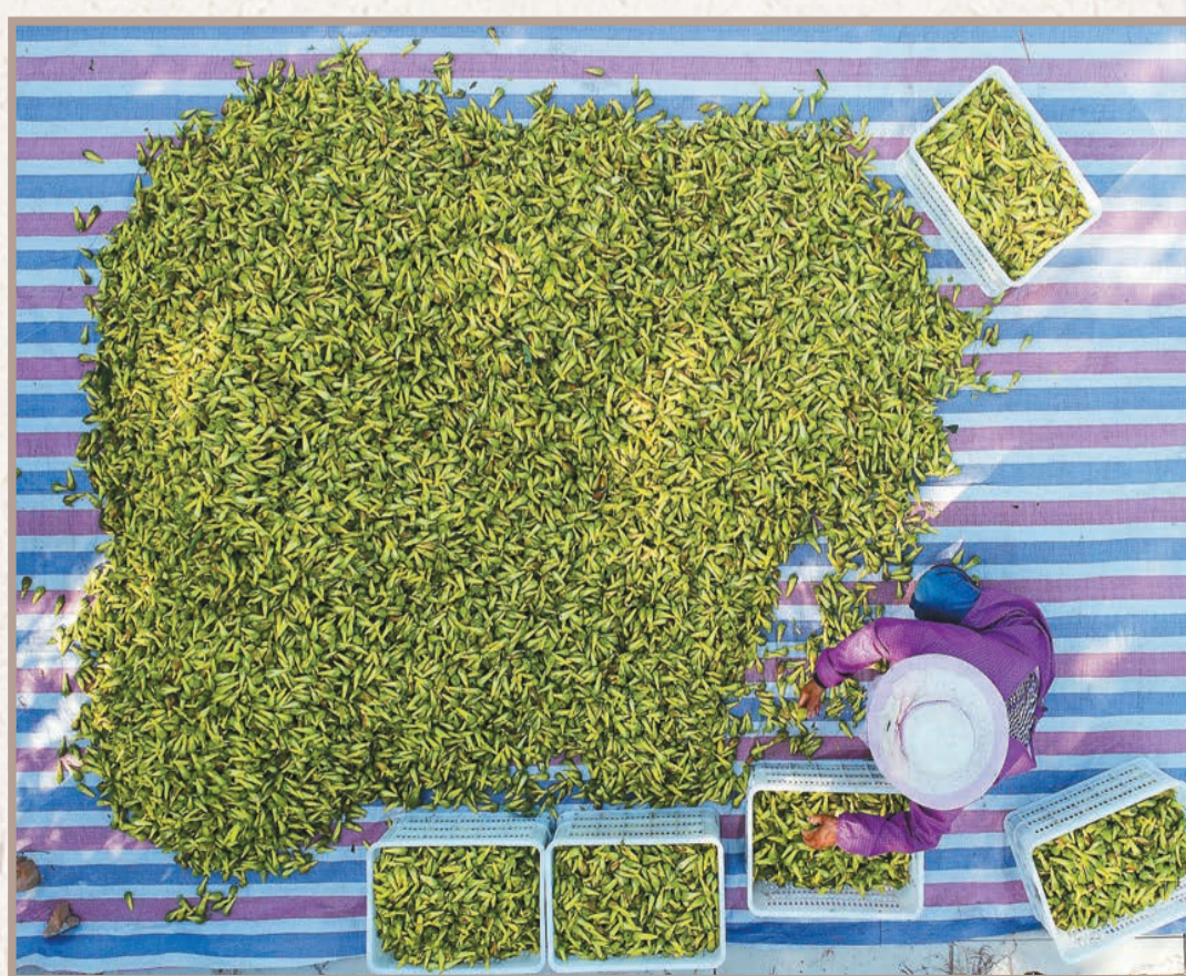
在內丘縣近郎村金花葵種植基地，農民正在整理剛剛採收下來的金花葵。