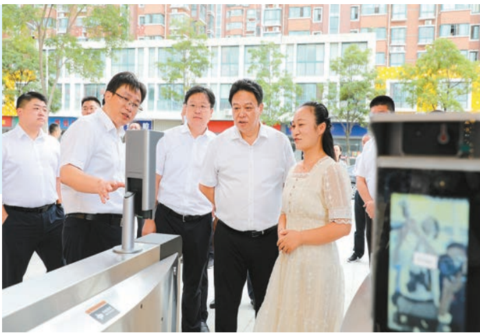
海安市委書記于立忠(右二)率隊考察海安教育發展情況

近日，江蘇省海安市召開教育發展大會，目標到2025年，全市公共教育體系更加完善，教育公平和教育質量明顯提升，教育結構更加科學合理，教育服務經濟社會發展的能力顯著增強，在全省率先實現教育現代化，建成全國有聲譽、全省居前列、系統有影響、群眾有好評的教育強市。