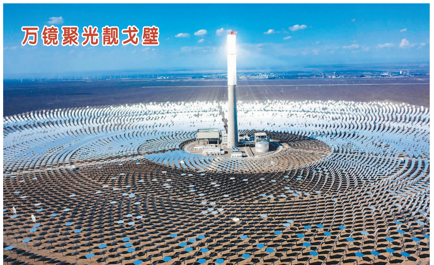
秋日时节，位于新疆伊吾县淖毛湖镇的戈壁上升风和日丽，哈密50兆瓦熔盐塔式光热发电站里，1万多面定日镜“逐日”而动，将百米高的集热塔照得发亮，成为了戈壁上升的风景。图为光热发电站外景。