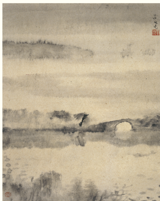
苏堤雨霁 69x44cm 2009年