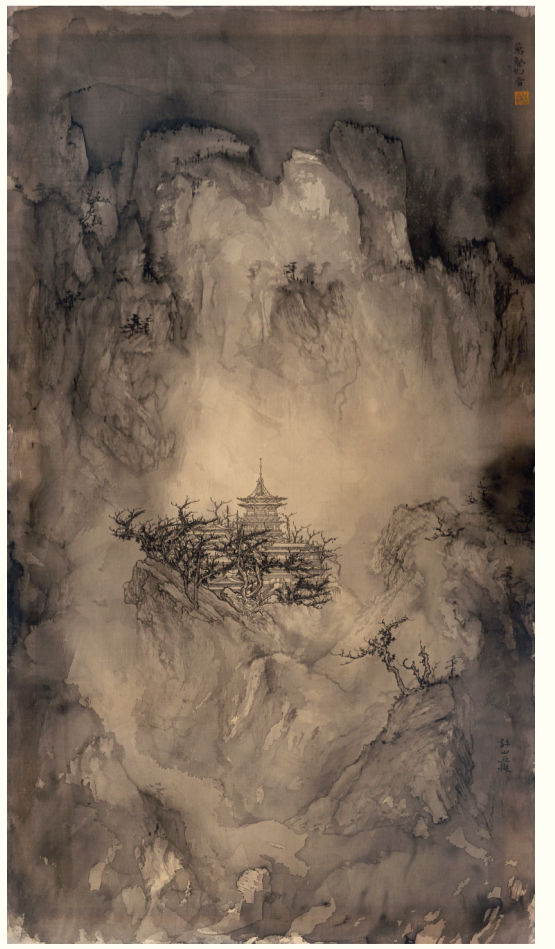
千壑幻雪 128x68cm 2020年 绢本水墨