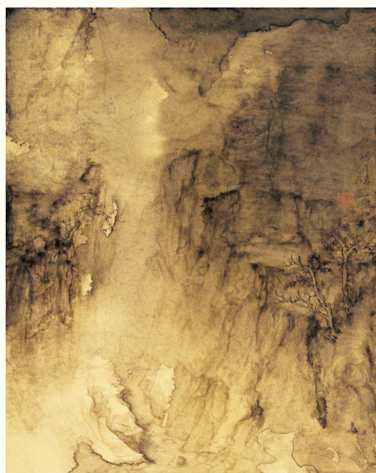
太行锡崖沟, 金笺水墨, 50 x 35cm, 2015年