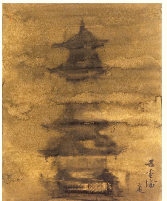
五重塔, 金笺水墨, 50 x 35cm, 2020年