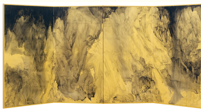
山外之山中, 308x165cm, 金笺水墨, 2018年