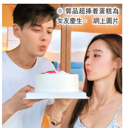
郭品超捧著蛋糕為女友慶生。

二人曾合作《三生三世枕上書》，2018年被拍到拖手夜遊，於2019年亦被爆同回酒店，但當時郭品超方否認稱是「朋友們一起聚餐」，直到前天馬澤涵生日，二人終於承認戀人關係。男帥女美獲不少網民讚合襯養眼，也由於兩人相差19歲，有網民則形容為「父女戀」。