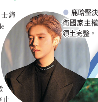
鹿晗堅決捍衛國家主權和領土完整。

鹿晗工作室在官方微博發表聲明稱：「Audemars Piguet(『愛彼』)品牌公開發表的不當言論，嚴重違反『一個中國』原則。本着負責任的態度，我方敦促愛彼品牌以中英文對照方式在全球平台上公開致歉，反覆溝通未果。基於此，鹿晗先生即日起終止與愛彼品牌的合作關係。」聲明還強調，國家利益高於一切，鹿晗與鹿晗工作室堅決捍衛國家主權和領土完整。