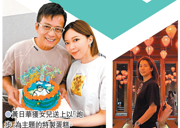
● 黃日華獲女兒送上以「跑步」為主題的特製蛋糕。

呂慧儀牛一收 11 個蛋糕 香港文匯報訊 (記者 梁靜儀) 「長腳蟹」呂慧儀大前日 (3 號) 39 歲生日，連日來她都忙於跟家人、同事慶祝，今年更收到 11 個生日蛋糕，感受到滿滿的愛。 她表示農曆新曆生日都在工作中度過，而日前一班有份拍處境劇《愛·回家之開心速遞》的演員就給她驚喜，送上蛋糕為她慶祝。而昨日雖然已過了生日，但長腳蟹仍有在社交平台上分享多張蛋糕相及短片，其中有她與一起生日的導演花花合照，她並留言表示今年生日吃了 11 個蛋糕，好滿足，好感恩，又稱讚劇組是有愛的團隊。 黃日華前日 (4 日) 正式「登六」，早前已與一班