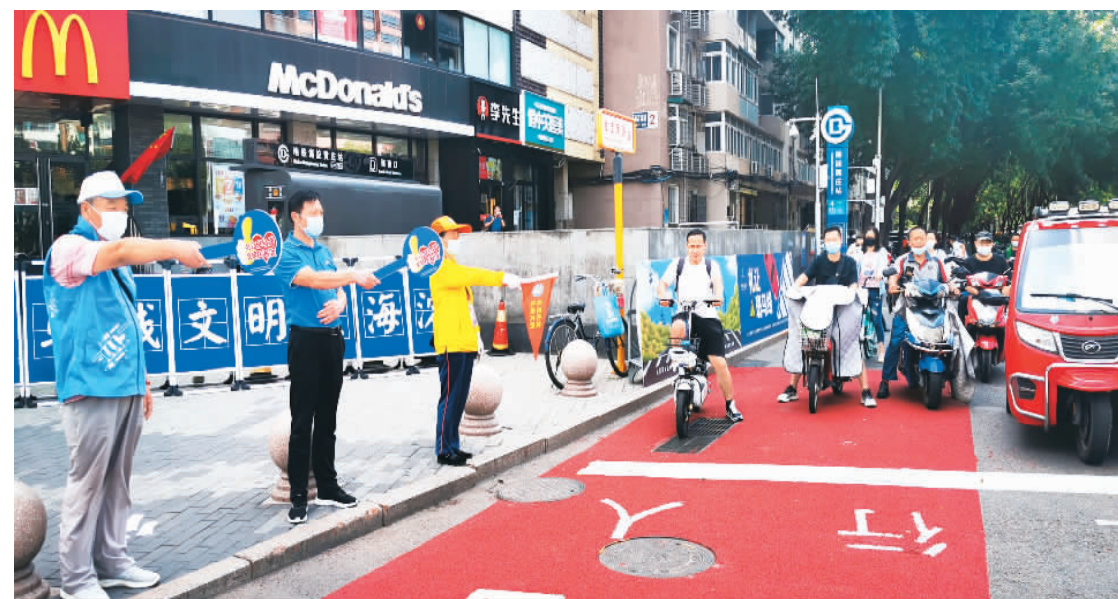
志愿者、文明引导员在北京市海淀区黄庄路口引导行人、非机动车文明出行。