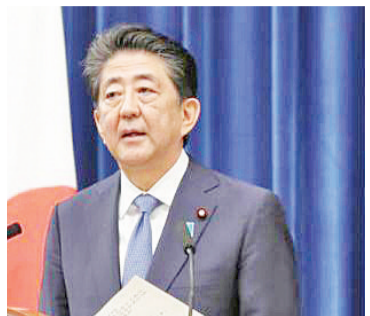
日本前首相安倍晋三