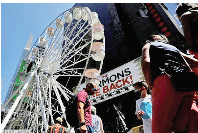
资料图:当地时间8月25日,美国纽约曼哈顿,时报广场建立了一个高达110英尺的摩天轮,这座摩天轮将从8月25日运行至9月12日。做为政府鼓励接种新冠疫苗的措施之一,每天将允许100名已经接种新冠疫苗的游客免费搭乘摩天轮。

中新网9月6日电 据新加坡联合早报网6日报道,最新分析显示,到2021年底,全球富裕国家估计会剩下多达12亿剂新冠疫苗,国际社会要其把疫苗转让给较低收入国家的压力将会加大。