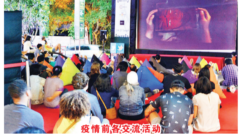
疫情前各交流活动

问:您是如何想到成立巴厘国际电影节? 答:因为本身的背景是电影拍摄和制作,因此居住在巴厘岛之后想用电影一种最直接的方式把文化和传统记录下来并传播给世界各地;同时,通过一系列的专业交流会和工作坊,让更多的弱势群体能够走进电影院进行体验。此外,在创办前咨询