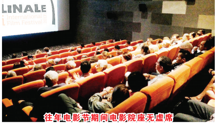
往年电影节期间电影院座无虚席