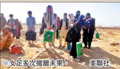
● 女足多次撤離未果。