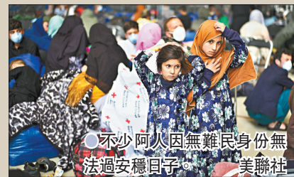
● 不少阿人因無難民身份無法過安穩日子。

美軍上月底宣布從阿富汗合共撤走近12.5萬人，除了美國公民和持簽證阿人外，還有許多屬高風險群體的阿富汗民眾，由於他們沒有簽證，未能獲得難民身份，抵達美國後缺乏援助，無法以難民身份申請定居資格及取得福利。部分人只能向國務院申請「人道主義假釋」，意味最多只獲為期90天的有限度援助，無法得到安置和醫療服務，顯得前路茫茫。