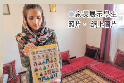
● 家長展示學生照片。

校區官員稱，被困學生均是於今年春天或初夏，由家長陪同前往阿富汗探望親人，當中部分學童在美國出生，屬美國公民。單在薩克拉門托聖胡安聯合學區，便有來自19個家庭的27名學童被困，校區發言人拉伊證實過去數日，一直無法與當中多個家庭取得聯絡。