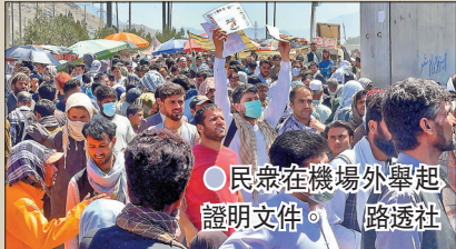
● 民眾在機場外舉起證明文件。