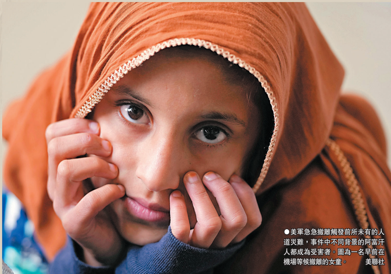
● 美軍急急撤離觸發前所未有的人道災難，事件中不同背景的阿富汗人都成為受害者。圖為一名早前在機場等候撤離的女童。