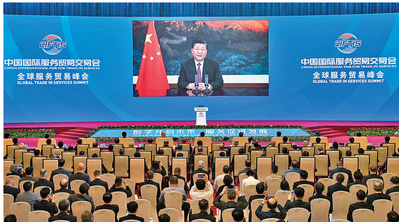
● 9月2日晚，習近平在2021年中國國際服務貿易交易會全球服務貿易峰會上發表視頻致辭。

香港文匯報訊 綜合新華社及央視網報道，中國國家主席習近平2日晚在2021年中國國際服務貿易交易會全球服務貿易峰會上發表視頻致辭。習近平在致辭中宣布，將深化新三板改革，設立北京證券交易所，打造服務創新型中小企業主陣地。