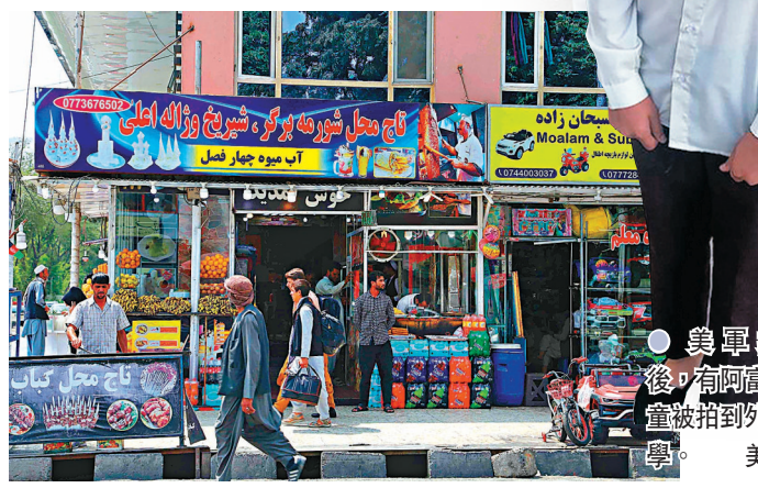
● 喀布爾商販恢復工作。

阿富汗局勢驟變、美方撤離行動混亂，以及 13 名美軍在喀布爾機場恐襲中身亡，使拜登政府飽受國內輿論和美國盟友批評。皮尤研究中心 8 月 31 日公布的民調顯示，近七成美國民眾認為美國未能在阿富汗實現目標。 ● 綜合報導