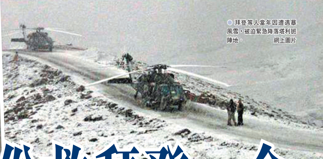
● 拜登等人當年因遭遇暴風雪，被迫緊急降落塔利班陣地。