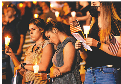
● 美國民眾悼念死去軍人。

美國總統拜登 8 月 31 日在美軍完成撤出阿富汗後，首次於白宮發言，堅稱結束阿富汗戰爭是正確決定，對此不感後悔，他表示美國將繼續展開反恐行動，打擊蔓延全球其他地區的恐怖主義，又重提美國需增強競爭力，應對中國和俄羅斯的挑戰。 卸責特朗普「不撤便要升級戰爭」 拜登對其從阿富汗撤軍的決定辯護，表示美國上屆政府去年與塔利班達成的協議，迫使他只能面對「撤出或戰爭升級」的選擇。拜登同時承認，美方對阿政府在美軍撤出後有能力維持一段時間的判斷並不準確。 拜登列舉美國在這場戰爭中付出的代價，包括 2,461 名美軍身亡，逾兩萬名美軍受傷，以及超過 2 萬億美元開支，「在阿富汗經歷 20 年戰爭後，我拒絕讓美國下一代去打一場早該結束的戰爭。」他表示美國會繼續使用「超視距」能力，打擊包括「伊斯蘭國」阿富汗分支在內的恐怖組織，即是在肉眼無法看到目標的情況下，透過雷達或長距離偵測系統追蹤敵方並進行打擊。