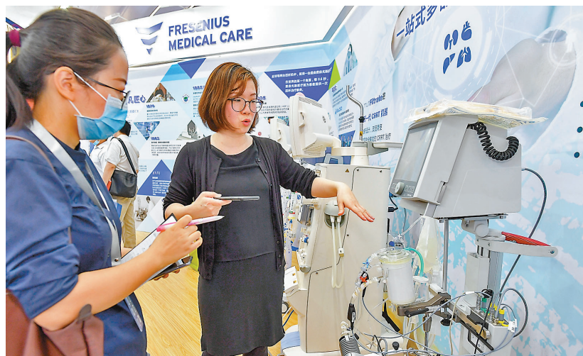
●海南省探索放寬個人跨境交易政策。圖為海南博鳌樂城國際新藥械展，吸引多家跨國企業及未在中國國內上市的藥械品種展出。