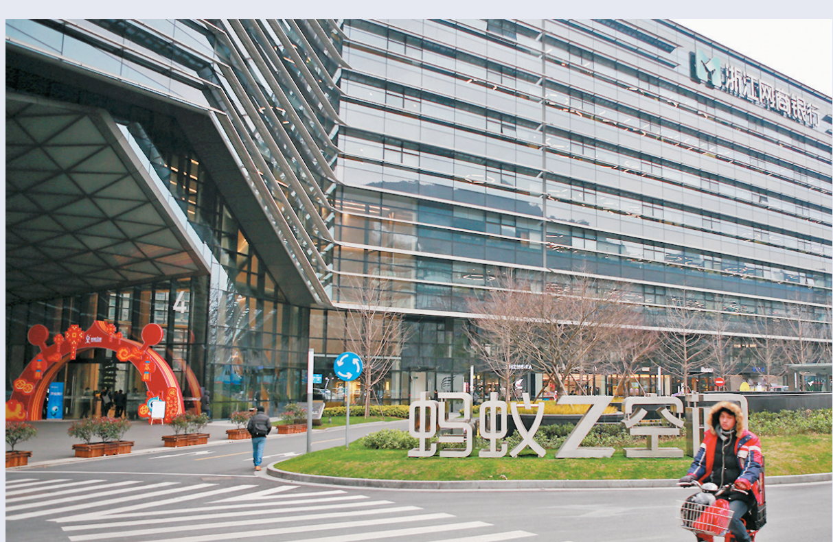
●有消息稱，螞蟻集團計劃與國資企業共同成立一間信用評級合資企業，預計最快於今年10月成立。