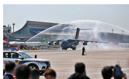
運送烈士遺骸的專機通過水門。

忠魂不泯，浩氣長存。儀式結束後，志願軍烈士遺骸棺槨被護送前往瀋陽抗美援朝烈士陵園。3日10時，第八批在韓志願軍烈士遺骸安葬儀式將在韓國陵園志願軍烈士紀念廣場舉行。2014年至2020年，累計有716位在韓志願軍烈士遺骸回到祖國，落葬於此。