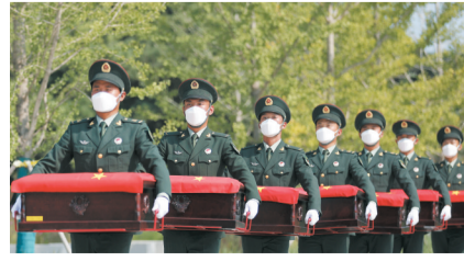
志願軍烈士的遺骸護送到瀋陽抗美援朝烈士陵園。