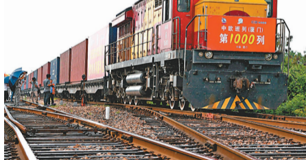
截至8月底，中歐班列今年已累計開行10,030列。圖為中歐班列(廈門)第1,000列從廈門站駛出。

香港文匯報訊 據新華社報道，9月2日上午，第八批在韓志願軍烈士遺骸回國，由解放軍空軍專機護送從韓國接回遼寧瀋陽，109位志願軍烈士英靈及1,226件相關遺物回到祖國懷抱。