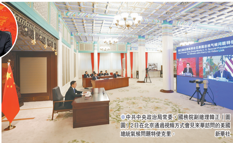
中共中央政治局常委、國務院副總理韓正(圖)2日在北京通過視頻方式會見來華訪問的美國總統氣候問題特使克里。

韓正表示，中國在應對氣候變化方面作出了巨大努力，也取得了顯著成效。習近平主席提出的中國力爭於2030年前實現碳達峰、2060年前實現碳中和的目標願景，體現了中國堅決履行《巴黎協定》、持續強化應對氣候變化的行動和決心，以及中國對推動構建人類命運共同體的責任與擔當。在應對氣候變化問題上，中國一直是言必信、行必果。