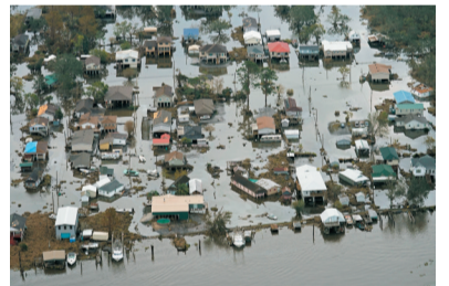
颶風「艾達」近日重創美國。

極端天氣更加頻繁和嚴重 排名前10的災害中導致人員傷亡最嚴重的是乾旱、風暴、洪水和極端氣溫，年均死亡人數從20世紀70年代的超過5萬降至21世紀頭10年的不到2萬；同一時期，經濟損失增加7倍，其中風暴是造成破壞的最普遍原因，帶來的經濟損失也最大。 世界氣象組織秘書長塔拉斯表示，氣候變化導致極端天氣、氣候和降水的次數正在增加，並將世界許多地區變得更加頻繁和嚴重。但嚴峻的統計數據後面是希望，經過改進的多災種早期預警系統已大幅降低死亡人數。