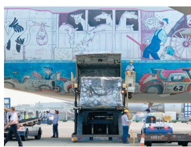
首批93萬劑復必泰疫苗2日運抵桃園機場。

首批復必泰疫苗運抵台灣後，仍須經過食藥部門檢驗封鎖，審查時間預計為兩周，最快9月中旬將優先提供12至17歲學生及18至22歲青年接種。後續將再視疫情趨勢、接種情況及疫苗到貨數量等綜合評估，開放其他對象接種。第二批約91萬劑復必泰疫苗預計一周後啟運。