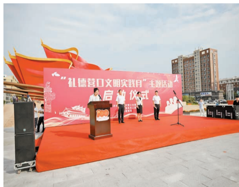
「禮德營口文明實踐月」主題活動啓動儀式現場。

【香港商報訊】記者張繼馳 王藝橋報道：兩名在縣區工作的機關幹部，創作出歌曲《只為你美麗》，經遼寧省營口市委宣傳部、營口市創建全國文明城市工作指揮部辦公室製成MV推出。這首創建全國文明城市的主題歌，將是「禮德營口文明實踐月」的主旋律，更是營口馳名而不息開展文明城市創建活動的決勝宣言。