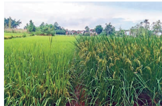
「巨型稻」（右）比普通稻（左）高2倍。

【香港商報訊】記者童文武 蔣熾報道：國家雜交水稻工程技術研究中心重慶分中心近日在重慶市大足區試種出超2米的「巨型稻」。不同於傳統水稻，「巨型稻」平均每畝水稻植株高達2米左右，可實現「稻魚共生」。據悉，「巨型稻」將面向全國推廣，預計3-5年內全國種植面積可超千萬畝。