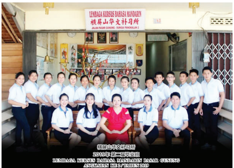
橫屏山華文補習所2016年第二屆畢業班