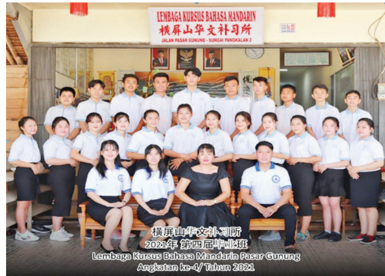
橫屏山華文補習所2021年第四屆畢業班