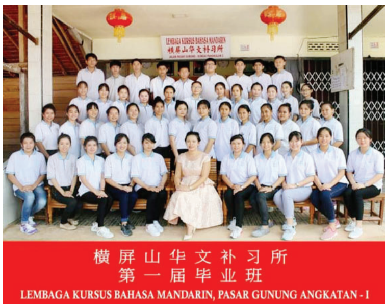
橫屏山華文補習所第一屆畢業班