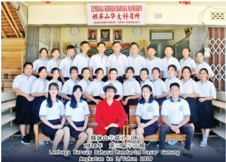
橫屏山華文補習所2020年第三屆畢業班