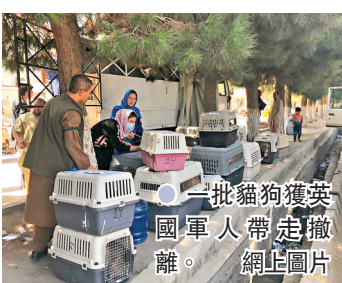
一批貓狗獲英國軍人帶走撤離。 網上圖片

英國28日晚結束在阿富汗的撤離行動，仍有眾多合格阿富汗人未能及時離開。在喀布爾開設動物慈善機構Nowzad的前英國海軍陸戰隊成員法辛，當天帶同收容所內約200隻貓狗，乘坐私人包機離開喀布爾，收容所一眾阿富汗員工卻被遺留當地，惹來猛烈批評，英國防相華禮仕亦說，軍方應優先撤走人員而不是動物。