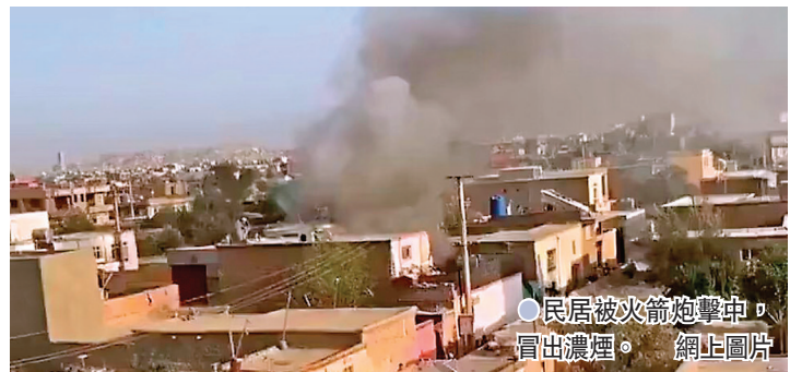
民居被火箭炮擊中，冒出濃煙。

就在美國警告喀布爾機場可能再發生襲擊後，當地29日再傳出爆炸聲，位於機場西北面一處民居據報被火箭炮擊中，造成最少6人死亡，包括4名兒童。就在差不多同一時間，美軍證實出動無人機，炸毀一輛正企圖向機場發動自殺式炸彈襲擊的汽車，國防部聲稱已經「消除威脅」。當地記者指，民居遇襲和美軍無人機出擊相信是兩宗不同事件，但由於現場情況混亂，暫時未能證實兩者是否有關。