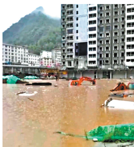
●陝西安康市10縣區116個鎮辦不同程度出現洪澇災害。視頻截圖

中韓雙方將於9月1日在韓國仁川共同舉行烈士遺骸裝殮儀式，2日上午在韓國仁川國際機場舉行交接儀式。運送志願軍烈士遺骸的專機抵達瀋陽後，退役軍人事務部會同相關部門將於9月2日上午在遼寧瀋陽桃仙國際機場舉行烈士遺骸迎回儀式，9月3日上午在瀋陽抗美援朝烈士陵園舉行安葬儀式。