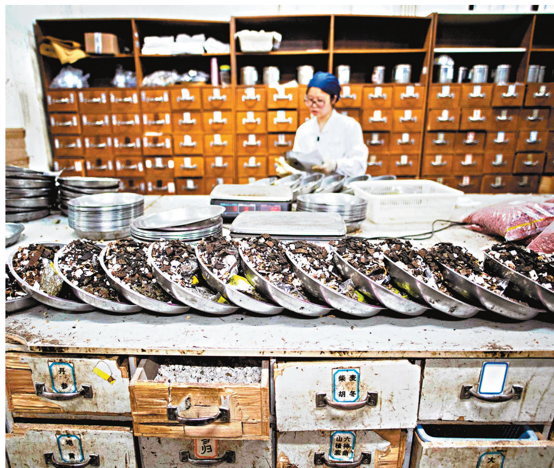
●上海推動中醫藥納入「四早」新冠肺炎防控體系應對德爾塔毒株，制定推廣了上海市新冠肺炎中醫藥預防方案。圖為上海中醫藥大學附屬岳陽中西醫結合醫院。資料圖片

在閔行區華漕鎮，4個隔離點承接了全市所有入境來閔任務和一部分入境中轉任務。龍華醫院與閔行區合作，把「龍醫正氣方」送入華漕集中隔離點，在防疫的具體實踐中發揮了作用。