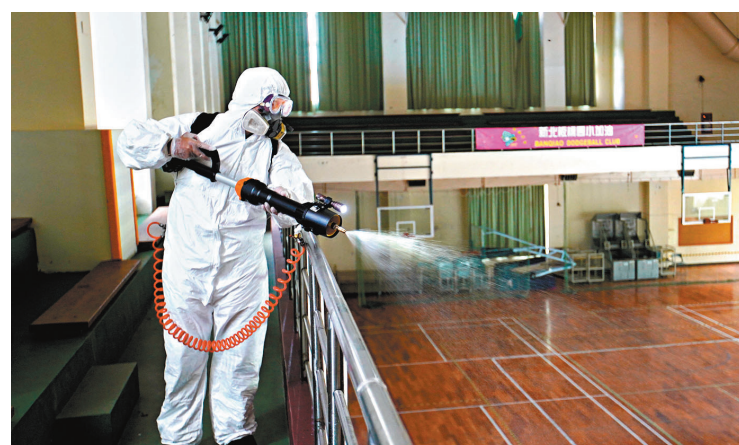
●新北市一所小學針對校內開放空間與學校周邊環境消毒。

接種後死亡，多人出現不良反應。高。據疫情指揮中心統計，預約接種者死亡是否與疫苗相關尚待專業的調查，但台灣民眾對「高端」疫苗副作用和安全性的擔憂持續升