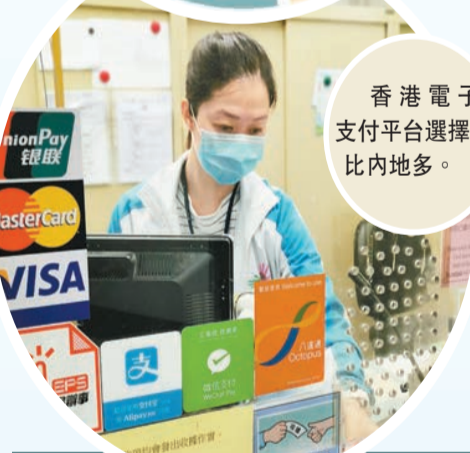
香港電子支付平台選擇已比內地多。