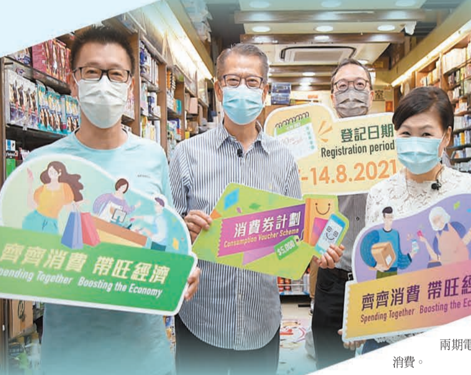
港府推出電子消費券大受市民歡迎，直接推動電子支付普及。