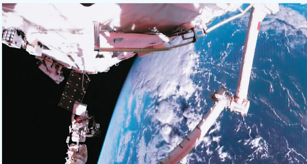
8月20日在北京航天飞行控制中心大屏拍摄的神舟十二号乘组航天员聂海胜、刘伯明同时在舱外操作场景。

短短两个月内，中国航天员两次成功出舱，引发外媒热议。多家外媒表示，太空行走是中国载人航天史上了不起的成就，多项关键技术的突破为舱外作业提供保障；未来，中国空间站将为太空探索作出更大贡献。