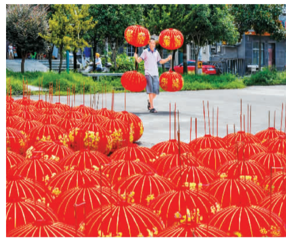
8月24日，在浙江省台州市仙居县横溪镇山枣园移民新村灯笼加工作坊，农民正晾晒红灯笼。

通过“订单+互联网”模式，该灯笼加工作坊实现年加工灯笼100多万只。红火的灯笼加工业务，带动了当地群众在家门口就业，拓宽了农民增收门路，促进当地实现共同富裕。