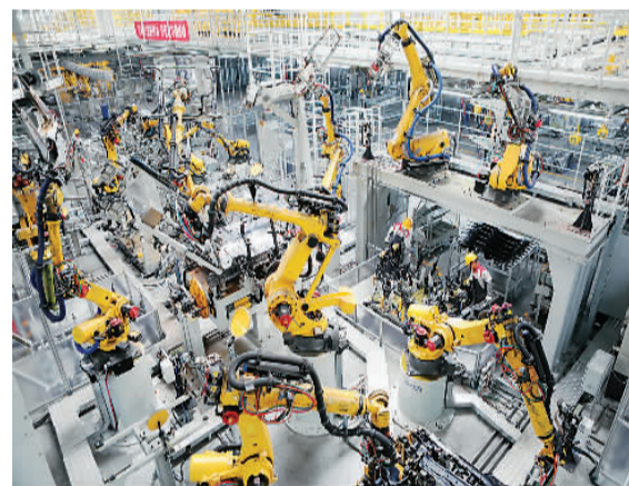
8月23日，在重庆市永川区长城汽车永川基地焊装车间，机器人焊接、搬运车辆零部件。