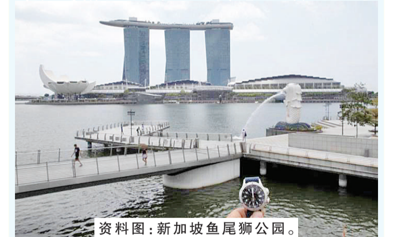
资料图：新加坡鱼尾狮公园。

中新网8月30日电 综合报道，当地时间8月29日，新加坡卫生部长王乙康表示，该国八成人口已顺利完成两剂新冠疫苗接种。路透社报道称，这使新加坡成为全球完全接种率最高的国家。