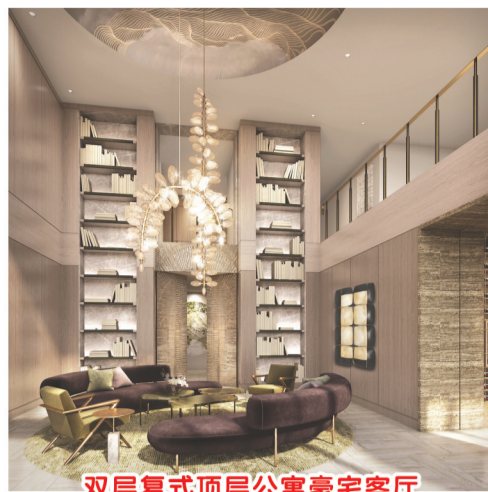
双层复式顶层公寓豪宅客厅