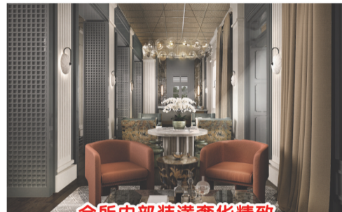
会所内部装潢奢华精致

地。室内设计由专注于奢华酒店设计的LTW Designworks负责。代表作包括首尔四季酒店和香港丽思卡尔顿酒店；景观设计由荣获FIABCI世界大奖赛卓越奖的STX景观设计事务所策划。