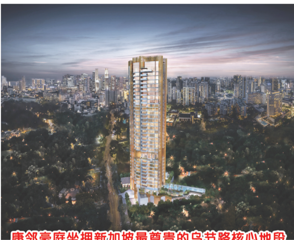
康邻豪庭坐拥新加坡最尊贵的乌节路核心地段