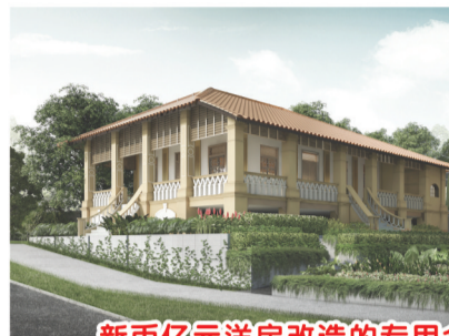
新币亿元洋房改造的专用会所