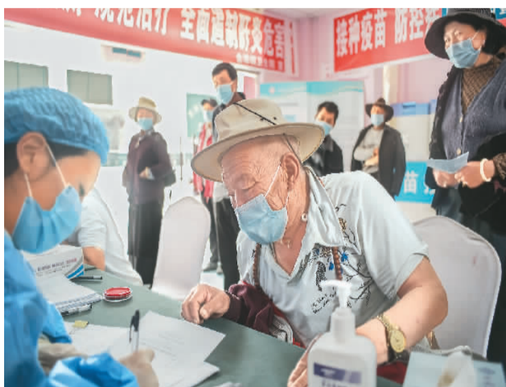
▲ 在四川甘孜州稻城县疫苗接种点,工作人员为准备接种人员登记信息。