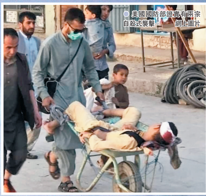
●美國國防部證實有兩宗自殺式襲擊。網上圖片