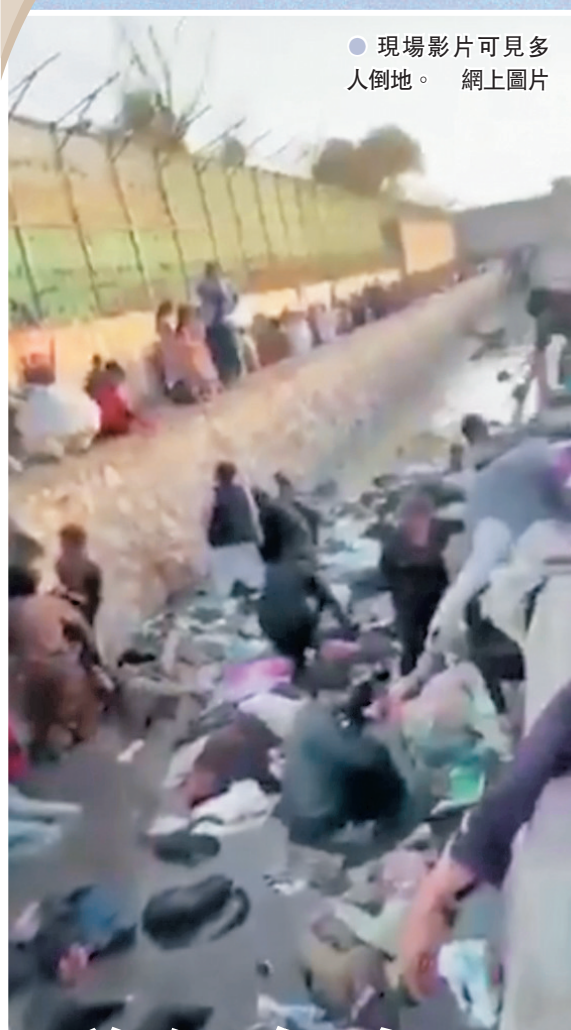
●現場影片可見多人倒地。網上圖片