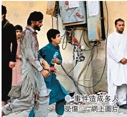
●事件造成多人受傷。網上圖片