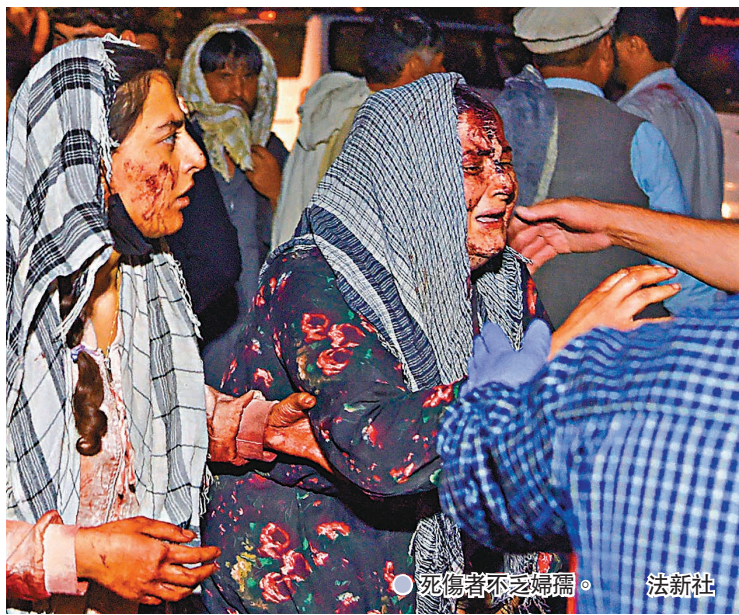
●死傷者不乏婦孺。