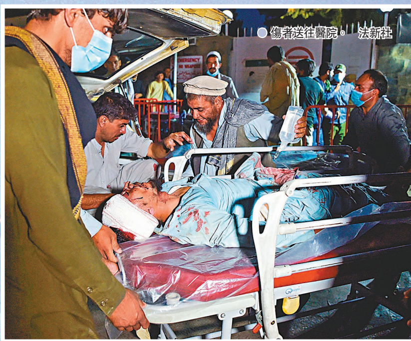
●傷者送往醫院。