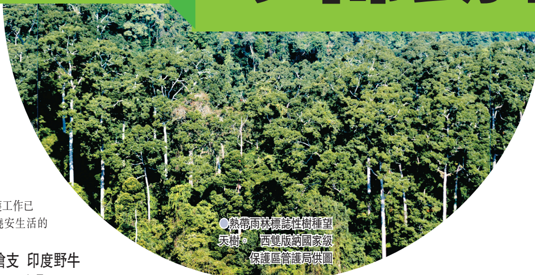
●熱帶雨林標誌性樹種望天樹。

據了解，此前工作人員聽老百姓說有野牛出沒，便展開了調查，卻從村民那裏得知，印度野牛已經有三四十年沒有在這個區域出現過了，工作人員在附近也沒能找到野牛出沒的痕跡，卻沒意外地在亞洲象食源基地的監控中發現了牠們的身影。