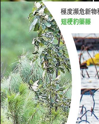
極度瀕危新物種：短梗釣藥藤