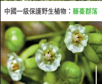
中國一級保護野生植物：藤蕨群落