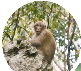
中國一級保護野生動物：阿薩姆猴 Macaca assamensis，也叫熊猴