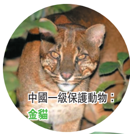
中國一級保護動物：金貓