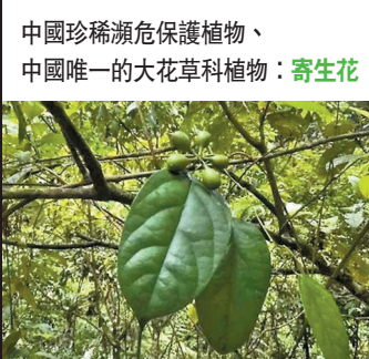
中國珍稀瀕危保護植物、中國唯一的大花草科植物：寄生花