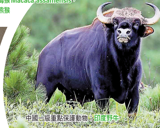
中國一級重點保護動物：印度野牛