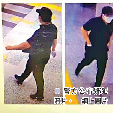
● 警方公布疑犯照片。