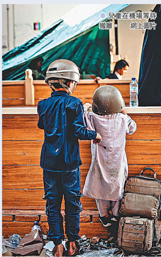
● 兒童在機場等待撤離。