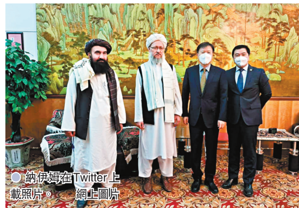
● 納伊姆在Twitter上載照片。