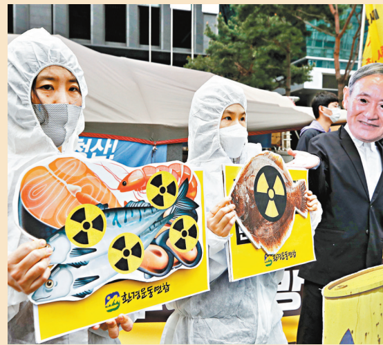
● 韓國民眾4月抗議日本計劃將核污水排出海洋。

管理日本福島第一核電站的東京電力公司25日公布，將會興建一條海底管道，將福島第一核電站多達127萬噸核污水，排放至核電站對開1公里的近海水域。中國央視25日發表評論，批評日本政府罔顧國內外強烈反對、單方面邁出威脅全球環境安全與民眾健康的危險一步，亞太鄰國乃至全球沿海國家均有權採取行動，向日方索賠。