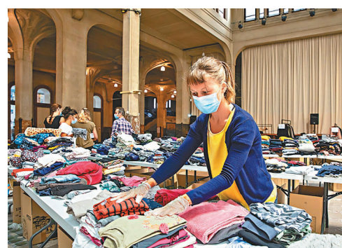
● 法國民眾為阿富汗難民捐贈衣服。