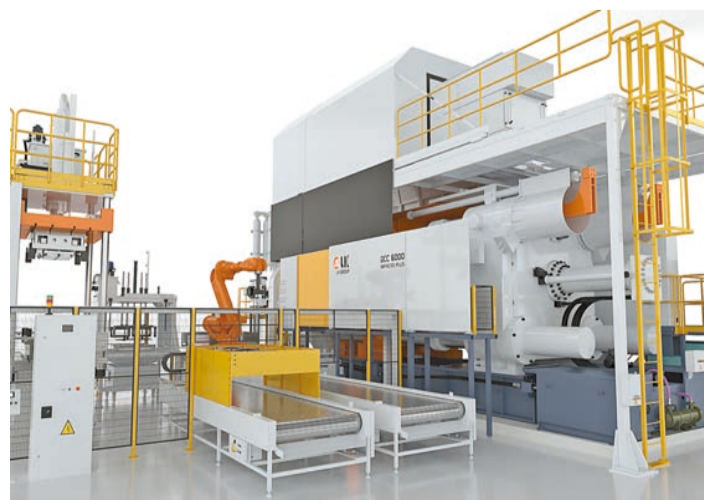
力勁集團研製的6000噸大型智能壓鑄機為美國著名電動車廠實現大型汽車結構件一體成型壓鑄技術。