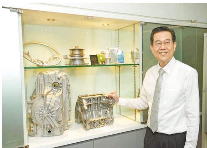
力勁研製的大型智能壓鑄機配備伺服節能系統，可節省60%以上的能耗，為環境保護作出貢獻。