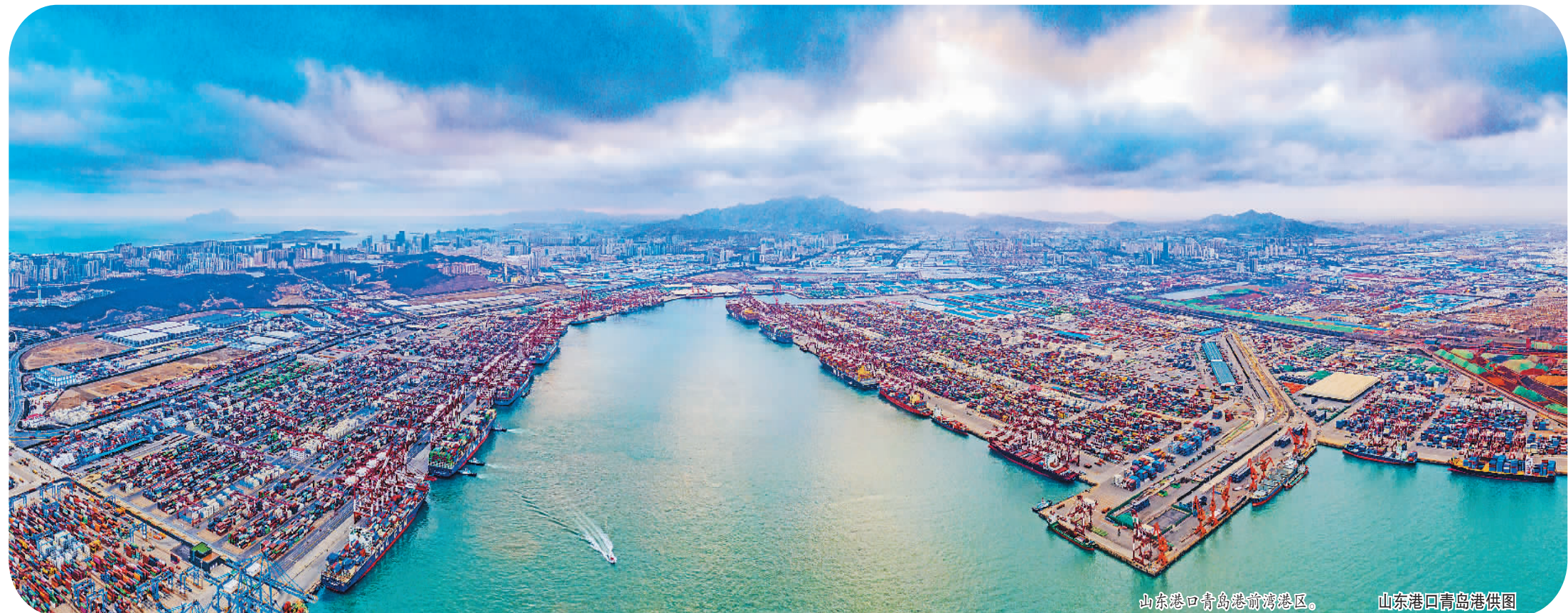
山东港口青岛港前湾港区。

已跑赢上半场的青岛，正在发力后半程。青岛外贸就像一艘远航的巨轮，在高质量发展的航道上乘风破浪，驶出新篇章。