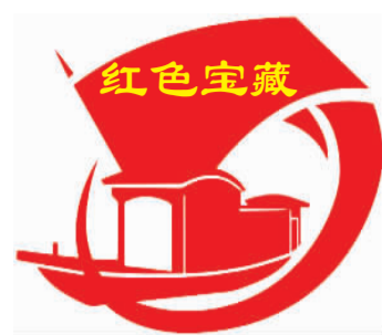
国家文物局特别支持

“红旗飘飘,军号响,剑已出鞘,雷鸣电闪,从来是狭路相逢勇者胜。向前进,向前进,向前进……”每当《中国军魂》气势如虹的旋律响起,人民军队用鲜血生命铸就的辉煌历史,便穿越岁月,呈现在人们眼前。 土地革命时期,中国红军在无比艰苦的环境下保存了革命的星星之火;抗日战争时期,一场平型关大捷,八路军让日军不可战胜的神话破灭;抗美援朝战场上,美军武装到牙齿,中国人民志愿军吃着炒面就着雪,将对手打到谈判桌前,美军称志愿军有着“谜一样的东方精神”,这个“谜”到底是什么?它就是人民军队英勇顽强、视死如归、血战到底的战斗精神。 习近平在庆祝中国人民解放军