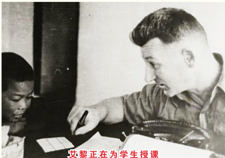
艾黎正在为学生授课