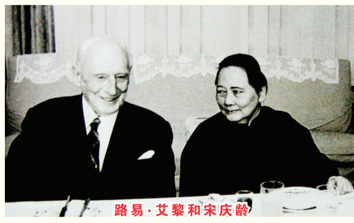
路易·艾黎和宋庆龄

1987年12月,艾黎在北京溘然长逝。他90年的人生中,有三分之二的时间是在中国度过的。无论是在