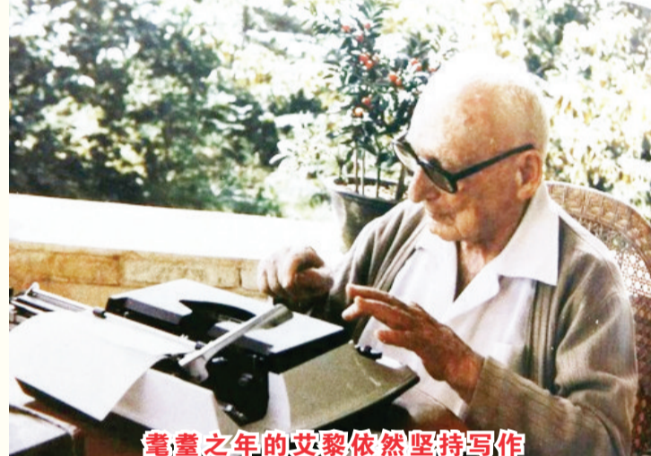
耄耋之年的艾黎依然坚持写作

革命和战争的艰苦岁月,还是在社会主义建设时期,艾黎总是坚定不移地同中国共产党站在一起,受到中国人民的尊敬和爱戴。