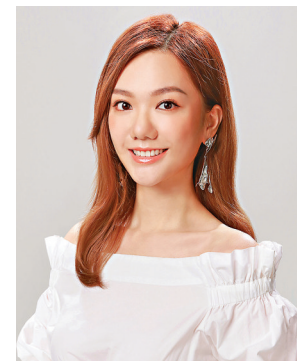
余詠童日前首輪已被飛出局。