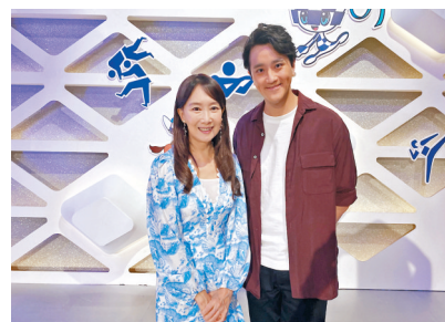
陳美齡表示唱多些好歌畀大家聽！