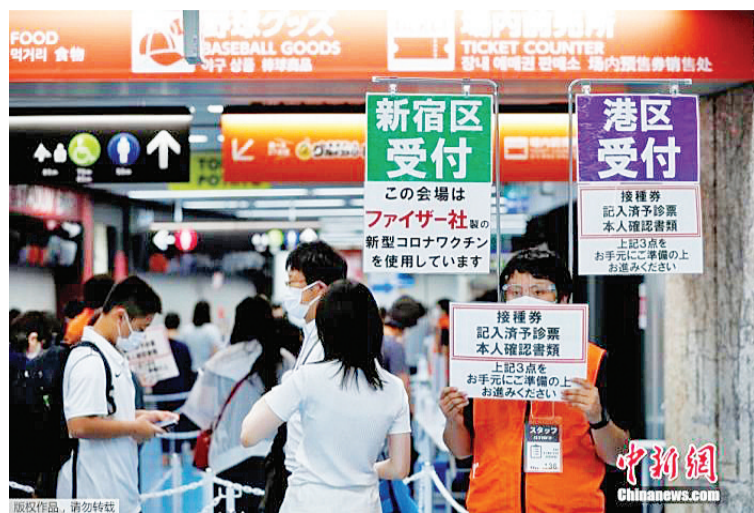
资料图:疫情下的日本。

中新网8月24日电 据日本放送协会(NHK)报道,第16届残奥会于当地时间24日晚在日本东京开幕。此前,东京奥组委透露,准备组织约13万名学生入场观赛。不过,鉴于新冠疫情形势严峻,东京都江户川区和江东区在24日宣布取消这一计划。 东京奥组委发言人高谷正哲22日表示,奥组委已经做好了迎接学生入场的准备,并表示各方将为学生打造尽可能“最安全”的观赛环境。 高谷正哲说:“东京都政府已经表示,大约有13