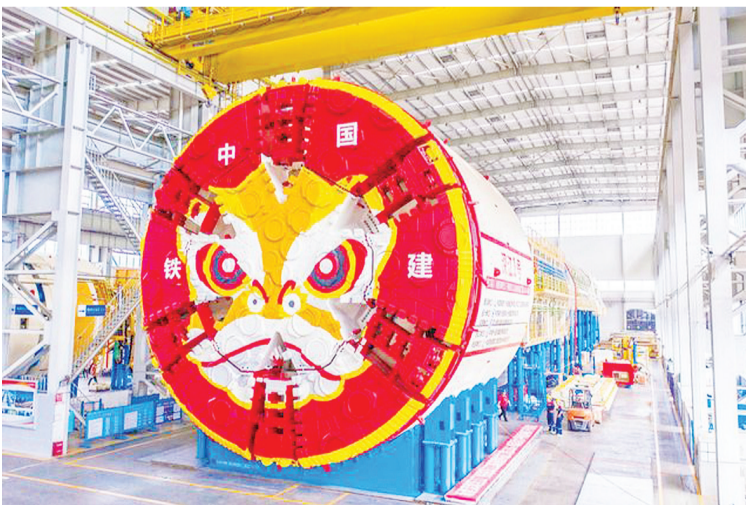
图为“深江1号”盾构机

珠江口隧道工程建设。盾构机名为“深江1号”，总长130米，总重3800吨，由中铁十四局和中国铁建重工集团联合打造。珠江口隧道为深江铁路重点控制工程，“深江1号”穿越区间全长3590米，最大埋深106米，高水压施工区域110米，为目前国内埋深最大、