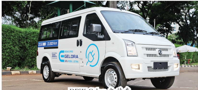
DFSK Gelora 电动车