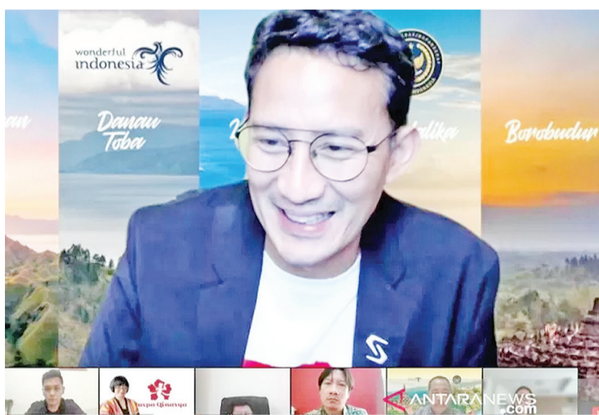
桑迪亚加·乌诺连线侨民推广印尼

参考消息网8月24日报道 安塔拉通讯社近日报道称，印尼旅游和创意经济部长桑迪亚加·乌诺对外公布了“印尼香料为世界增添乐趣”计划(Indonesia Spice Up The World, 英文简称ISUTW)。他表示，该计划的目的是不仅是扩大香料出口、增加外汇收入，更是为了拓展印尼美食在国际上的影响力。