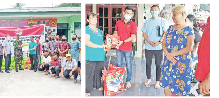
和军分区军员合作分发生活必需品包裹