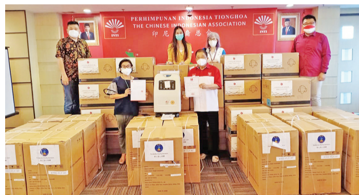
新冠肺炎疫情发生以来,全世界都无法置身事外,当前印尼也面临严重的疫情