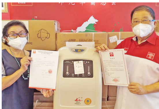
【本报讯】中国华侨基金会日前通过印尼华裔总会向印尼捐赠医疗物资。