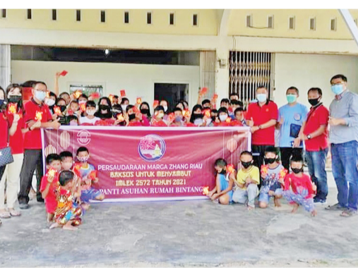
春节时分发红包给孤儿院小孩