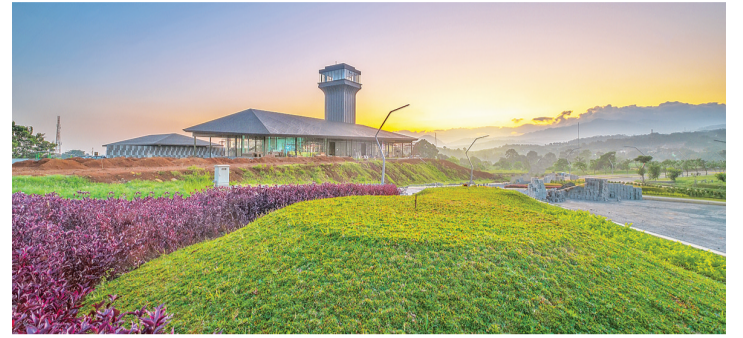
10 月份茂物 Summarecon 新城将开业

【本报讯】2021 年 8 月 24 日星期二,全宝集团(PT Summarecon Agung Tbk)举行线上“2020 年度股东大会”。会议议程批准公司的年度财务报告,包括批准财务报表、活动报告、公司和监事会 2020 财政年度的监督职责报告。 疫情大流行影响了世界上几乎所有业务领域,包括印尼的房地产业也不例外。这种情况自 2020 年以来一直在发生,并且仍然一直持续到现在。然而,凭借 PT Summarecon Agung Tbk. 品牌的实力,战略的实施和良好的公司治理,创新和保持