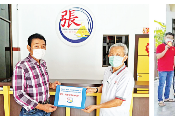
张氏代表捐赠善款给“氧气之屋”