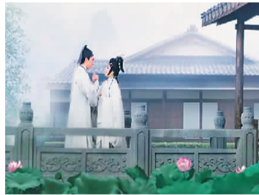
粤剧电影《白蛇传·情》剧照。