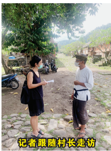
记者跟随村长走访

每个村落入口以栅栏的形式设计,有时候诧异这个不到1米高的木栅门还不是一户当地大户人家的大门,但却是整个村落的进出口。走进村落,宽长长的休息长亭(Bale Agung)直接映入眼帘,此处是村庄所有重大行政决策的所在地。旁边有个鼓楼(kul-kul),每天早上敲打21次以开始新的一天。