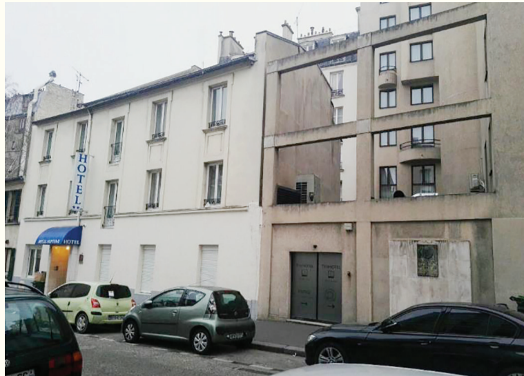
周恩来法国住所(这幢建筑右下角是纪念牌)

作用。”邓颖超对欧洲议会的访问,则是全国人大首次派团访问欧洲议会。欧洲议会议长韦伊夫人对她表示,只有中国和欧共体在世界上占有它们应有的地位,国际关系的平衡才能得到保证。从个人感情上讲,邓颖超的法国之行,是推迟了六十年的约会。1920年,周恩来赴法国留学,邓颖超留在国内进行革命活