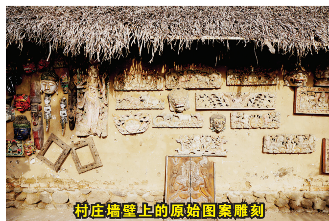
村庄墙壁上的原始图案雕刻

想真正了解并走进巴厘岛古老文化的您,并想感受传统中还夹着浓浓的田园自然气息,一定要走进现代数字时代下还依旧延续着传统生活的腾加南村! 本报记者 叶露