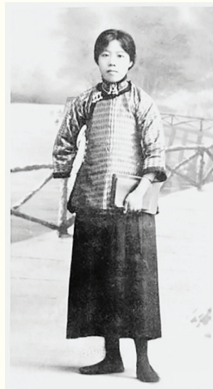
青年时期的邓颖超