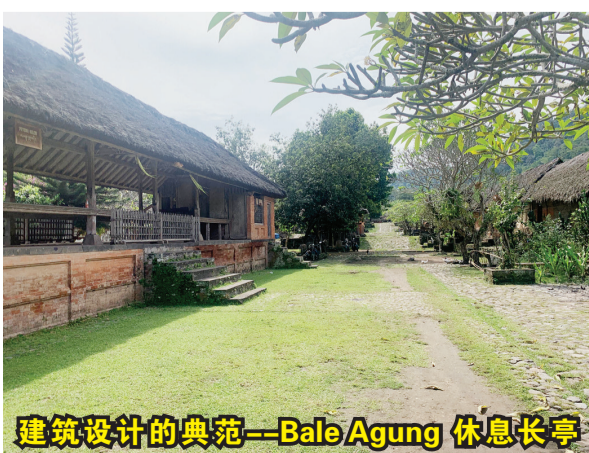
建筑设计的典范—Bale Agung 休息长亭

腾加南村民为最原始的巴厘岛人,也是前满者伯夷王国的后裔。阿迦文化对谁居住在村里有着严格的规定,只有在村里出生