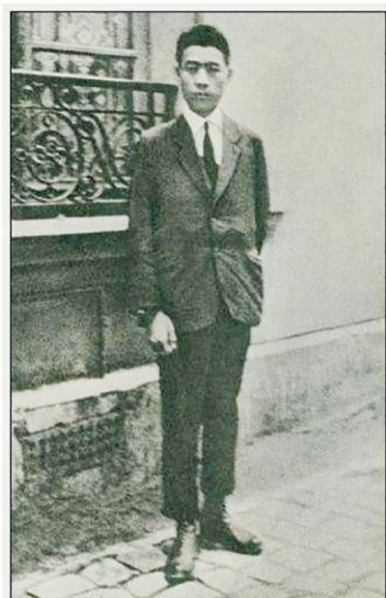
周恩来在巴黎住所

法国对邓颖超的来访极为重视,总统德斯坦在爱丽舍宫亲切会见邓颖超。国民议会议长戴尔马举行了隆重欢迎仪式,热情地说,“我们都知道,您不仅是全国人大常委会副委员长,而且是周恩来总理的夫人。周恩来总理的品格和才能在法国是众所周知的。而您对他的工作帮助很大,表现了作为他妻子的突出优点。”邓颖超对中法友谊予以高度评价。她说,“法国是周恩来同志和现在我国领导人邓小平、聂