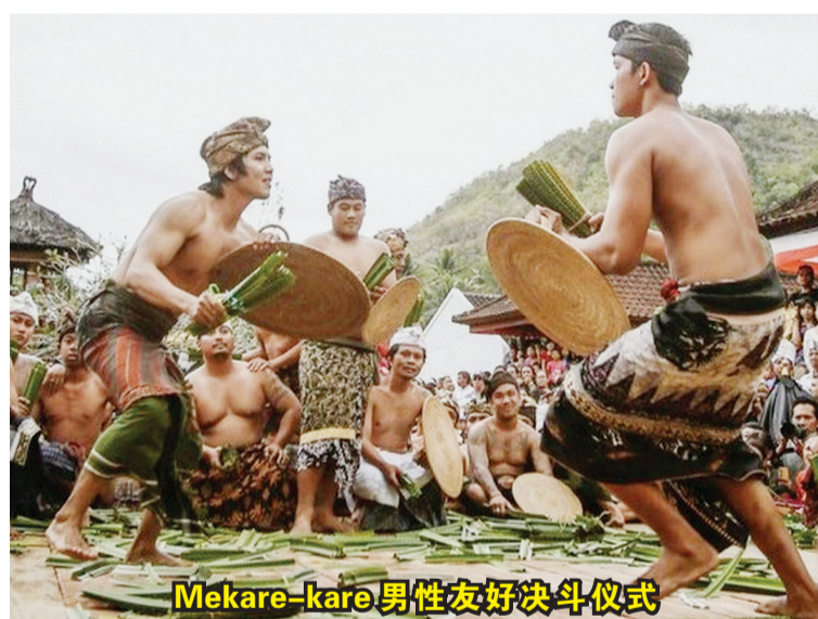
Mekare-kare男性友好决斗仪式

男人之间进行友好地决斗:一手拿着一个小藤盾,另一只手拿着一包刺带的香兰叶。此仪式为了祭祀战神和已逝的祖先,通常一般在每年6月举行。