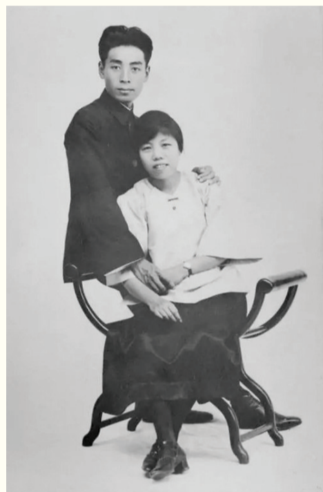
周恩来与邓颖超结婚照

邓颖超还出席了巴黎市长希拉克(即后来的法国总统)举行的欢迎酒会。希拉克说,“和中国保持良好关系是法国外交政策的重要因素。一个强大对欧洲是重要的。在当今存在的令人不安的紧张形势下,我们完全赞同加强欧洲与中国之间的经济、技术与文化关系。”邓颖超完全赞同希拉克的意见,“我们也有一个强大和联合的欧洲,希望欧洲在世界上起更大的