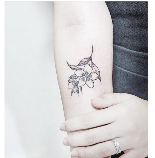
备受欢迎的鸡蛋花文身