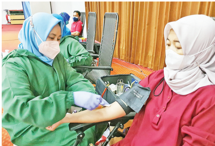
红十字人员在采集血浆