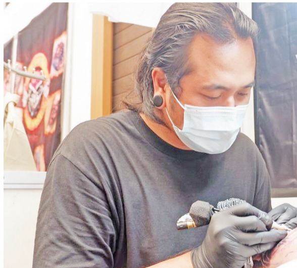
马德先生在文身中