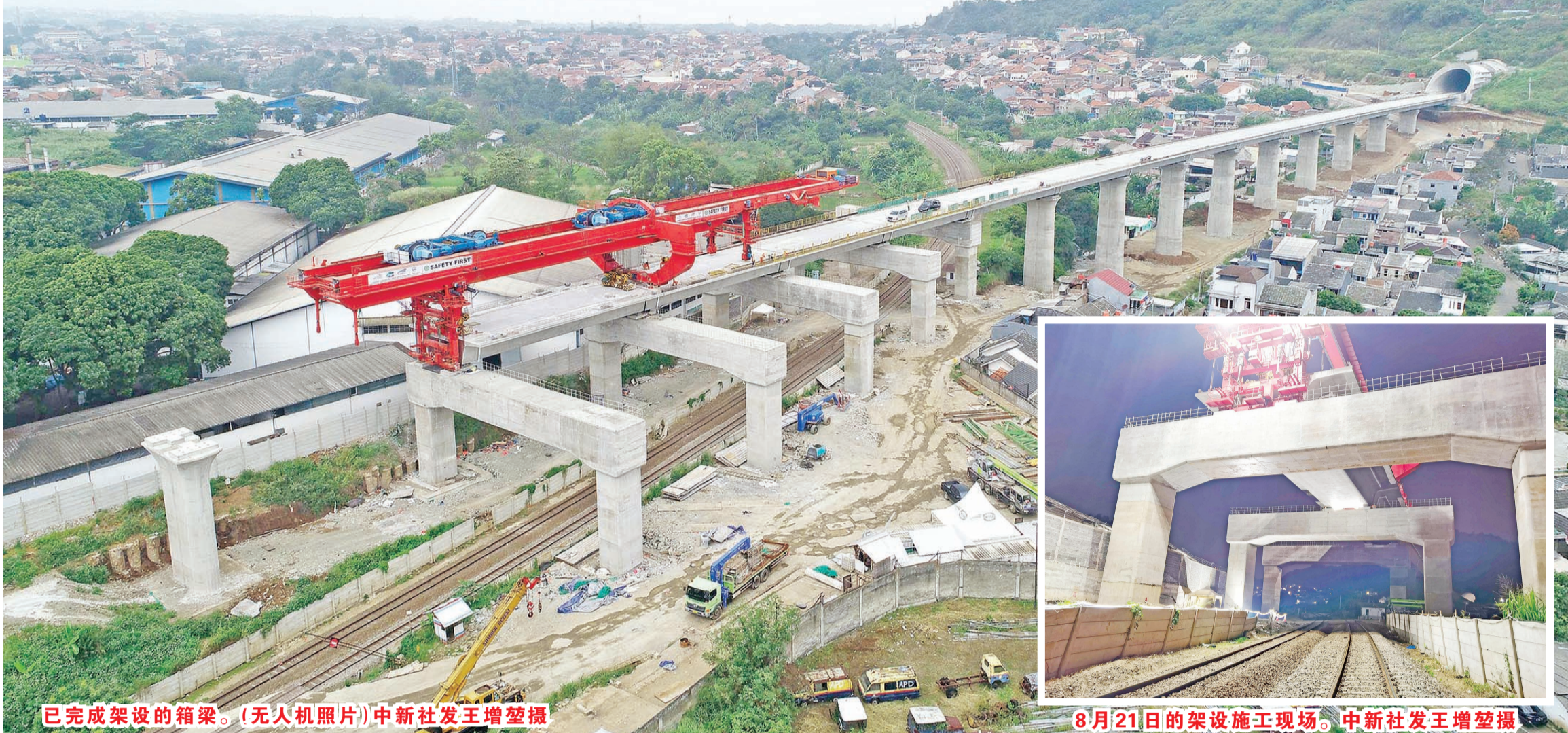
已完成架设的箱梁。(无人机照片)

隆,全长约142公里,最高设计时速350公里。建成通车后,雅加达到万隆的时间将由现在的3个多小时缩短至40分钟左右。