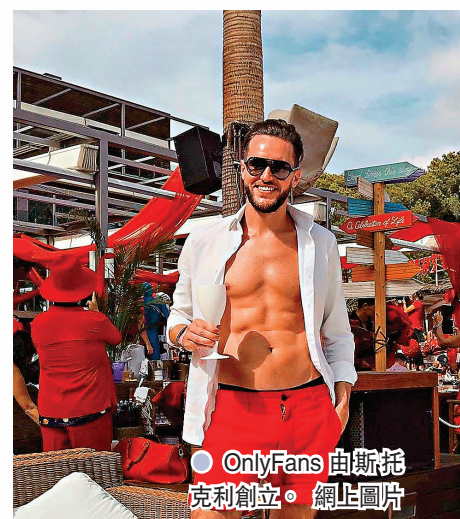
● OnlyFans 由斯托克利創立。

雖然擁有大量付費用戶，但 OnlyFans 近年一直難獲投資者青睞。許多投資者批評 OnlyFans 充斥太多色情內容，恐影響平台與其他品牌合作，更存在用戶違規發布兒童猥褻內容的風險。