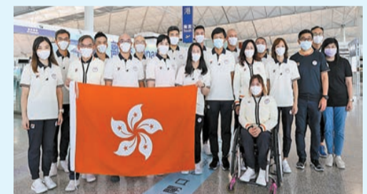
射擊隊及輪椅劍擊隊出發參加東京2020殘奧會。

中國香港代表隊在東京奧運創下歷史佳績，香港現時體育氣氛熾熱。因應東京殘奧會8月24日至9月5日舉行，有線電視、香港開電視、香港國際財經台昨日於觀塘apm商場舉行「東京2020殘疾人奧運會」記者招待會，除會直擊殘奧開幕及閉幕禮外，更會每日直播最少5小時賽事，並會安排播放每日精華片段。