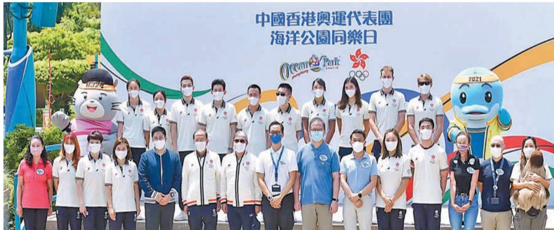
奧運代表團出席海洋公園同樂日。

【香港商報訊】記者戴合聲報道：海洋公園昨日舉辦奧運代表團同樂日，多名參加東京奧運的中國香港隊代表出席，包括乒乓球代表隊成員李皓晴、杜凱琹和黃鎮廷；羽毛球混雙運動員鄧俊文和謝影雪。不少市民昨日特意入園，一睹運動員風采，並爭相與他們合照，現場氣氛十分熾熱。