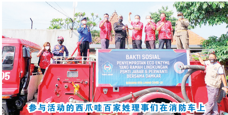
参与活动的西瓜分会理事们在消防车上