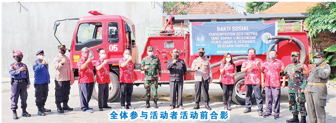
全体参与活动者活动前合影

有害成分,家家户户每天所排出的这些化学污染,综合起来足以对地球造成极大的伤害。因为丢弃的厨余会释放甲烷(methane)废气,比二氧化碳导致地球暖化的程度高21倍。环保酵素所产生的臭氧层,有杀菌的功能,同时增加空气含氧量,还使地球的温度不会继续上升。化厨余为自己做的环保清洁剂,可节省家庭开销。爱护地球就从厨房开始,用过的环保酵素最后流到下水道,能分解和消灭有害微生物和霉菌,可疏通马桶或水槽,还能净化河流与海洋。(雪妮报道)