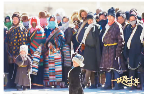
《一跨千年》中，那曲市中扎县下乡德仁村村民参与与鸟朵大赛。鸟朵即用来抛石块的绳子，使用鸟朵是牧人们的传统技能。